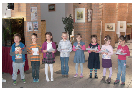
A rajzpályázat helyezettei

Az óvoda Vizuális - és Környezet munkaközössége a fenti címmel hirdetett rajzpályázatot nagycsoportos óvodások részére a Föld napja (április 22.) alkalmából. 26 kisgyermek pályázott. A zsűri döntése alapján az alábbi kategóriákban nyertek rajzeszköz csomagot a gyerme-