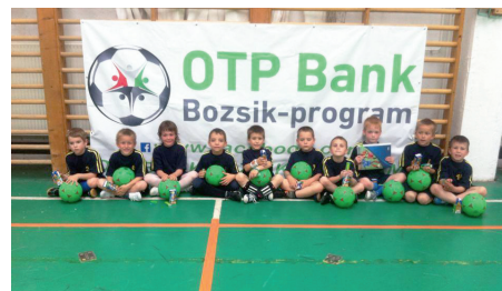
Bocsik-programban résztvevő gyermekek