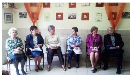
Lajosmizsei Pedagógus Nyugdíjas Olvasókör